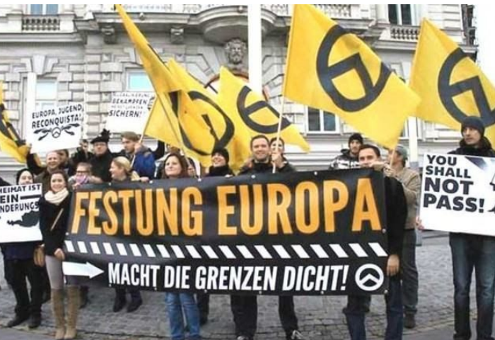
(protestanti pro populism in Germania)