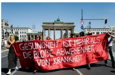
Protest anti-mască în Berlin. Se scandează sloganul: Sănătatea înseamnă mai mult decât simpla absență a bolii (ref. la Covid)

Un subiect despre care speram că voi vorbi doar în glumă sunt conspirațiile. Firea umană intuiește că efectele mari trebuie să aibă cauze la fel de mari, chiar dacă acest lucru nu este mereu adevărat: este mai ușor de crezut că marile puteri au pus la cale virusul decât să accepți că este vorba de o mutație naturală a unui material genetic care a devenit brusc foarte infecțios. Aspectul amintit mai sus corelat cu volatilitatea internetului din ziua de astăzi fac ca o informație să fie tot mai greu controlată. O astfel de strategie se regăsește des la redacțiile care vânează rating fără scrupule. Ba mai mult decât atât, politicienii promovează astfel de practici și răspândesc conspirații la rândul lor. Având acum o vedere de ansamblu mai clară asupra subiectului putem înțelege apariția protestelor anti-mască sau a celor care învinuiesc tehnologia 5G pentru virus. Un partid politic care răspândește constant astfel de idei este partidul german de extremă-dreptă Alternative für Deutschland care este responsabil de organizarea unui protest