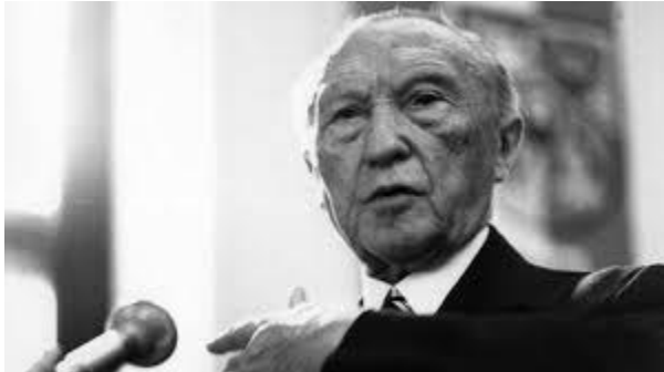
Fig. 1 Konrad Adenauer.

Lideri vizionari, au inspirat crearea Uniunii Europene în care trăim astăzi. Dintre acestia doresc sa mentionez pe : Konrad Adenauer, Nicole Fontaine, Jean Monnet si Joseph Bech. În 1957, Tratatul de la Roma pune bazele Comunității Economice Europene (CEE), cunoscută și sub denumirea de „piața comună”.