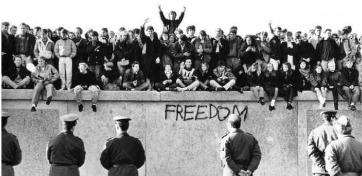
Fig 1: Căderea zidului Berlinului