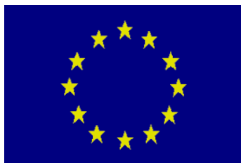
Fig.2 Drapelul Uniunii Europene.

2007. O criză financiară lovește economia mondială în septembrie 2008. Tratatul de la Lisabona este ratificat de toate statele membre ale UE, înainte de a intra în vigoare în 2009. Acesta pune la dispoziția Uniunii Europene instituții moderne și metode de lucru mai eficiente.