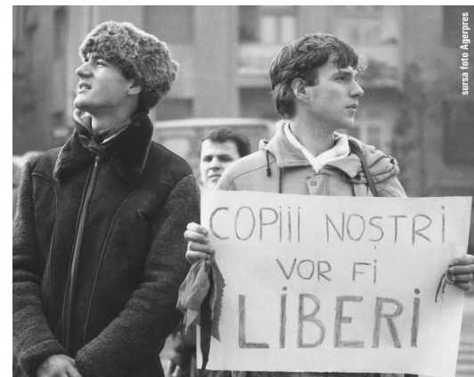
Fig 2: Revoluția din România

Ambele evenimente surprind ceea ce, câțiva ani mai târziu aveau să fie temeiurile pe care se naștea rolul politic al „Uniunii Europene”. Valorile ca demnitatea umană, libertatea, democrația și egalitatea sunt țeluri pentru care ni s-au sacrificat strămoșii de-a lungul istoriei.