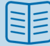
Filozofare in munca sociala zilnica