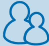
Pornografia in lumea reala