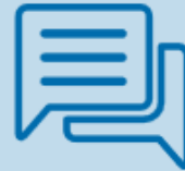
Impulsuri de comunicare